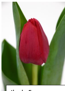
Ile de France